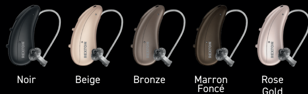
Noir Beige Bronze Marron Foncé Rose Gold