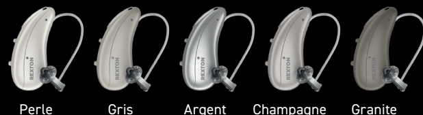
Perte Gris Argent Champagne Granite