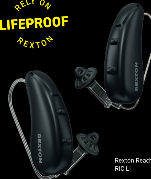
Rexton Reach RIC Li